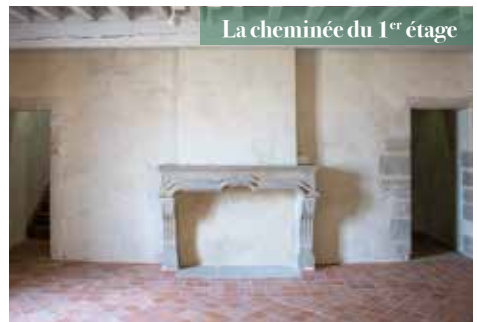
La cheminée du 1 er étage

La chambre du prieur, située au-dessus de la cuisine, est dotée d'une cheminée, d'un évier (signe de richesse) et d'une petite porte en biseau donnant accès directement à l'ancienne tribune au fond de l'église.