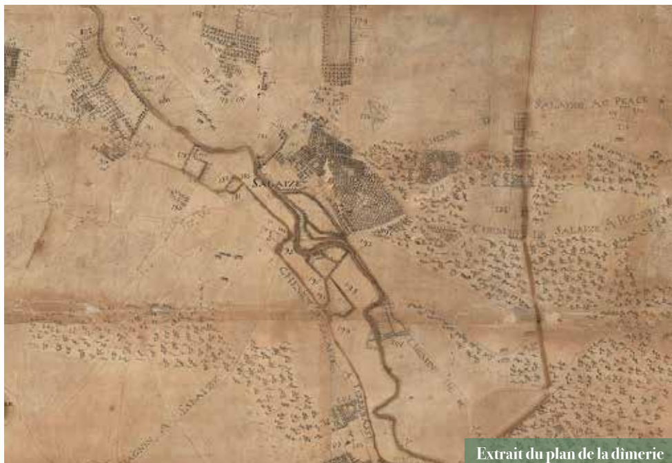
Extrait du plan de la dîmerie

La pièce du fond au rez-de-chaussée a probablement servi de dortoir pour les moines. De nos jours, elle abrite la reproduction d'un document exceptionnel : le plan de la dîmerie datant de 1752.