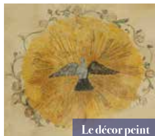
Le décor peint

De cette période, on retrouve la majeure partie des bâtiments visibles de nos jours : la reconstruction du clocher et de la nef plus petite que l'actuelle, la construction de la sacristie, un nouveau décor peint dans le chœur, l'agrandissement de la cour de l'ancien cloître et la création