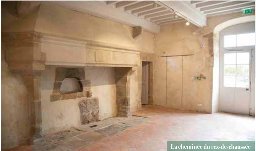
La cheminée du rez-de-chaussée

En entrant au rez-de-chaussée, on remarque deux magnifiques cheminées adossées datant de l'époque Renaissance.