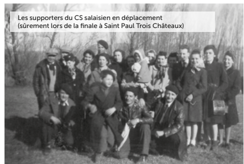
Les supporters du CS salaisien en déplacement (sûrement lors de la finale à Saint Paul Trois Châteaux)