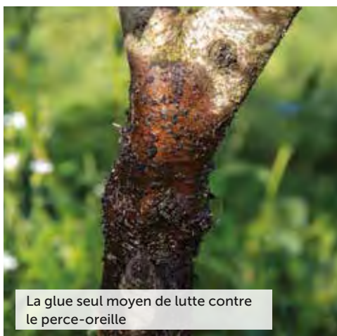
La glue seul moyen de lutte contre le perce-oreille

Le dérèglement climatique se fait durement sentir ces dernières années avec les périodes de gel tardif et les sécheresses. Les arbres ont