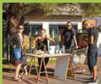
CAFÉ DE RENTRÉE OFFERT AUX PARENTS PAR LE SOU À FLORÉAL

Il est important qu'un maximum de parents se mobilisent lors de ces manifestations et de leurs préparations et lors des quelques sollicitations au cours de l'année.