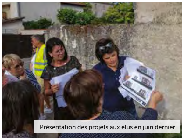
Présentation des projets aux élus en juin dernier

L'architecte-conseil de la commune apporte également des préconisations concernant l'insertion des projets dans le site.