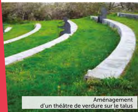
Aménagement d'un théâtre de verdure sur le talus