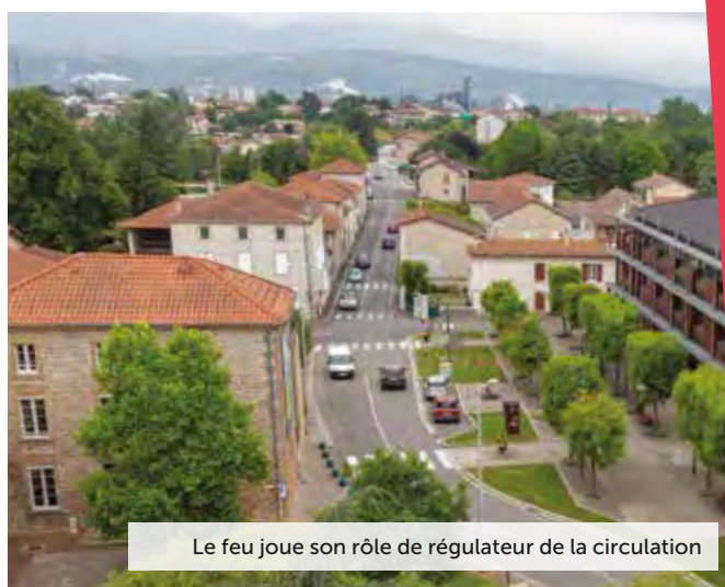
Le feu joue son rôle de régulateur de la circulation

Ces réflexions seront poursuivies cet automne.