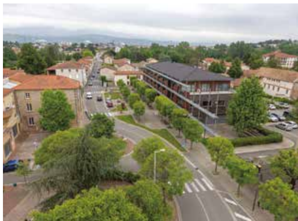
Une étude sur les déplacements est en cours.

La communauté de communes EBER a lancé le marché sur le Transport du Pays Roussillonnais avec étude d'une nouvelle ligne de transport en commun. La commune souhaite que les déplacements domicile-travail soient privilégiés et que les zones les plus densément peuplées soient desservies.