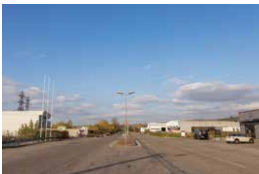
Impasse du Renivet

Dans le cadre de la démarche Salaise Durable, la ville a engagé de nombreux projets en lien avec la mobilité douce. Le conseil de quartier avait également réfléchi sur ces thématiques en travaillant sur la mise en place d'un cheminement doux bordant les rives de la Sanne depuis le Prieuré au nord jusqu'au pont de l'autoroute au sud.