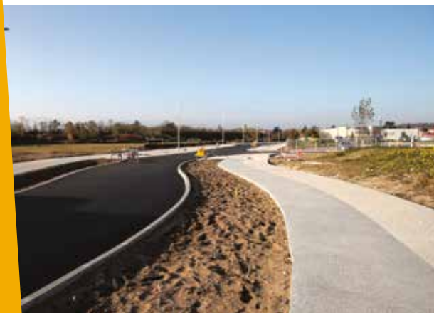
Rue Louis Saillant

Dans le cadre de la démarche Salaise Durable, la ville a engagé de nombreux projets en lien avec la mobilité douce. Le conseil de quartier avait également réfléchi sur ces thématiques en travaillant sur la mise en place d'un cheminement doux bordant les rives de la Sanne depuis le Prieuré au nord jusqu'au pont de l'autoroute au sud.