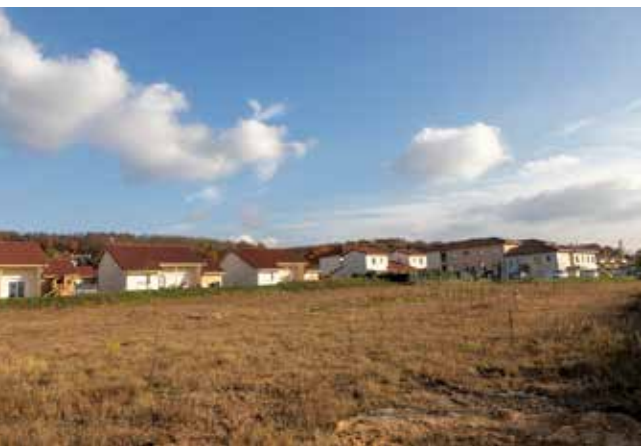
La résidence autonomie sera implantée au quartier des Sables

Le permis de construire de la résidence autonomie doit être déposé en mairie en fin d'année. Le projet sera porté par Habitat et Humanisme, gestionnaire de l'établissement ( www.habitat-humanisme.org ). En effet, suite à l'étude de besoins portée par une partie des élus du territoire et à l'appel à projets lancé par le Conseil Départemental de Isère, compétent en matière d'autonomie, le projet initial porté par 10 communes et la Mutualité Sociale Agricole n'a finalement pas été retenu par le Département.