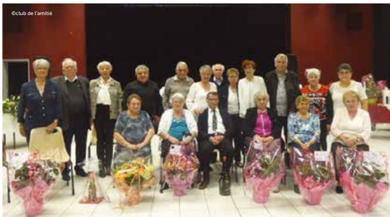
Noces d'Or et anniversaires 80 et 90 ans honorés lors du banquet