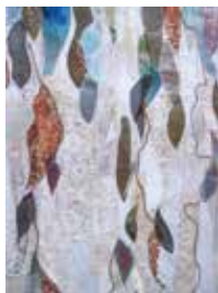
© Danielle Pradon / Mireille Dugard