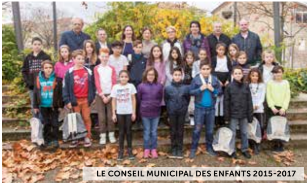
LE CONSEIL MUNICIPAL DES ENFANTS 2015-2017

Le Conseil Municipal d'Enfants, version 2015-2017, arrive au terme de son mandat. Les jeunes élus ont fini le projet d'une journée en famille avec le «Petit Cluedo Salaisien». Sous la chaleur mais dans une bonne ambiance, 27 familles sont venues aider l'inspecteur LEKEUF à résoudre l'assassinat de M. DUMAIRE... Après un parcours d'environ 1h30 dans les rues du village, les jeunes enquêteurs et leurs parents ont été récompensés par des petits lots, ainsi qu'un goûter, et des boissons fraîches bien méritées!